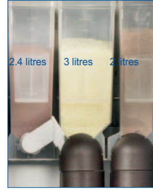
Canisters with different capacities

Kolay yükleme. Temel kabin çok fonksiyonlu, Programlanabilir.