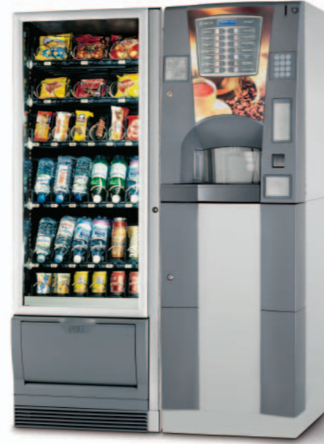
Snakky ve Snakky SL ile birleşmeyi sağlayan dikey donanım